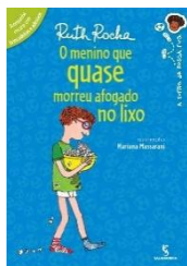
Ilustração: Mariana Massarani